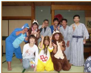
実行委員のみなさん 企画からお疲れさまでした

1日目、昇仙峡の紅葉はまだ少し早かったですが、景色を楽しんだり、モンデ酒造のワイナリーを見学したりと楽しみました！宿泊は笛吹市の春日居温泉・笛声旅館さんに泊まりました。夕食の時には豪華な食事とみなさん得意のカラオケを披露してくれました。2日目は世界遺産「忍野八海」をグループ行動しました。行き帰りのバスの中では日ごろの職場での話をいろいろとしていました。