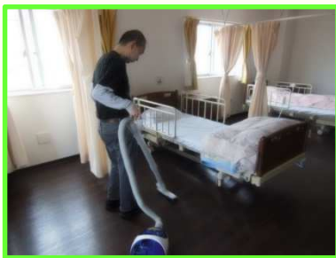
介護施設での清掃業務

銚子市地域自立支援協議会就労分科会では障害のある方の職場体験をはじめ、就労意欲の向上、また企業の障害者雇用への理解及び促進を図ることを目的に、平成24年度から職場体験実習を行っています。東総就業センターでは、職場体験実習を受け入れてくださる企業や職場体験実習を希望する対象者の調整を担当させていただいています。