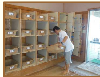
企業のみなさまに協力いただき さまざまな作業を経験できました