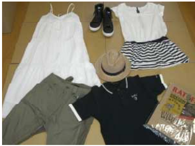
新作の一例です。 メンズ&レディースの