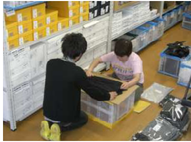
綺麗な積み方を教えて もらうTさん。