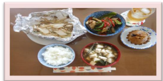
鮭のホイル焼きとナスとピーマンの味噌炒め