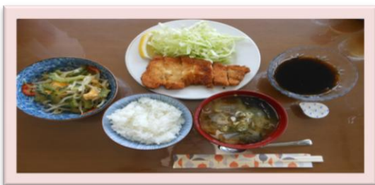
とんかつとゴーヤチャンプルー