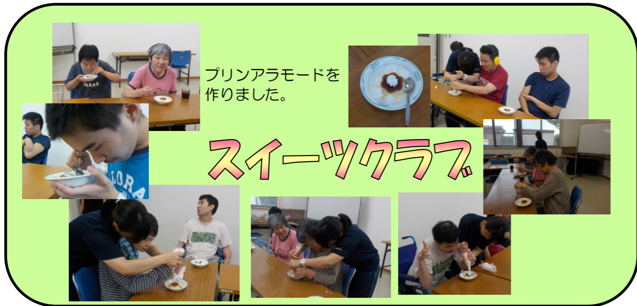
プリンアラモードを作りました。

今回は7月26日（水）に行われた「スイーツクラブ」「佐原探訪クラブ」の様子をご紹介します。