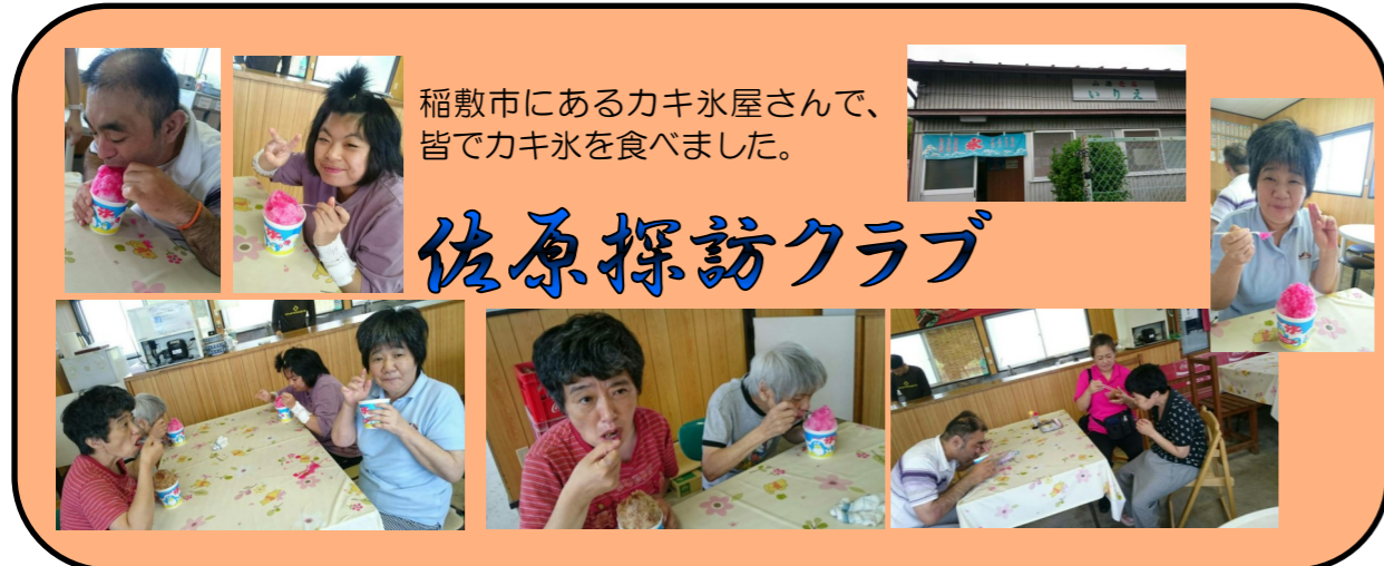
稲敷市にあるカキ氷屋さんで、皆でカキ氷を食べました。