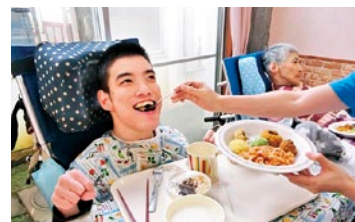
美味しくて笑顔が止まらない☆