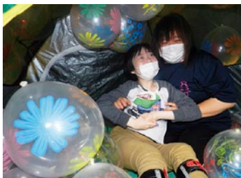
スペースマウンテンへようこそ