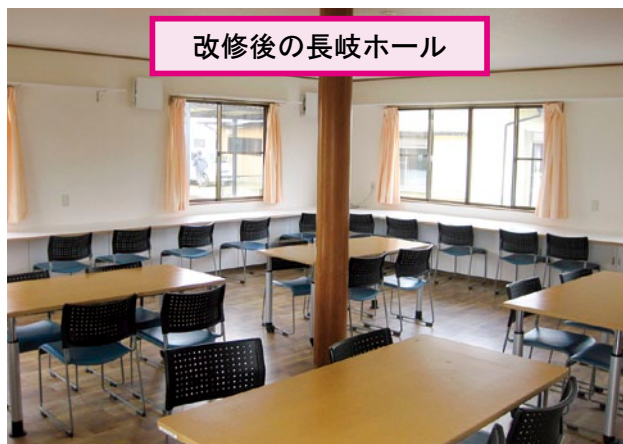
改修後の長岐ホール