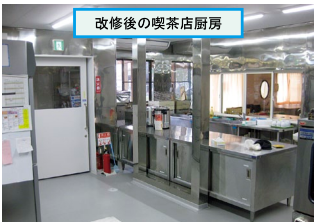
改修後の喫茶店厨房