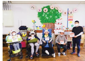
HAPPY BIRTHDAY 🎂