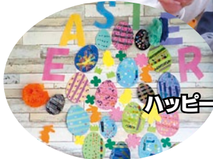
ハッピーイースター (#^#)