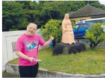
わくわくスタンプラリー