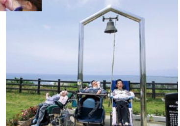
飯岡灯台へドライブ〜♪