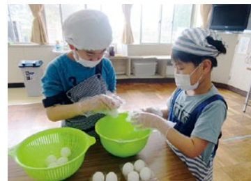
殻むきががんばります