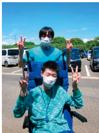
気持ちいい青空に🌞