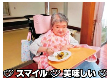
♡ スマイル ♡ 美味しい ♡