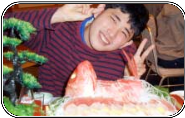
▲「うわ～、大漁だ～！」みんなの家