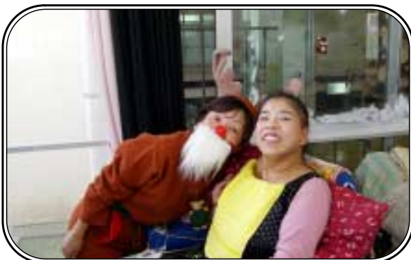
▲「かわいいでしょ！トナカイさんと私」聖マリア園