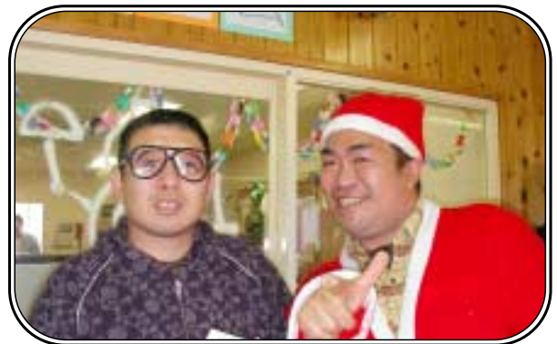
▲「めがね、似合いますか??」聖家族園