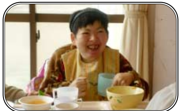
▲「クリスマス会のごちそうとってもおいしかったよ」 聖母療育園