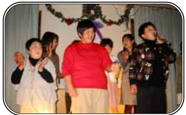
▲「サンタさん聞こえますか？」佐原聖家族園