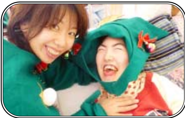
▲「トナカイさんとハイポーズ」聖母療育園