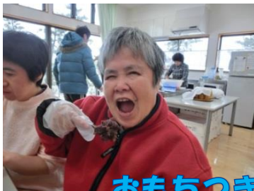
おもちつきや、おどろにの準備を行っております。