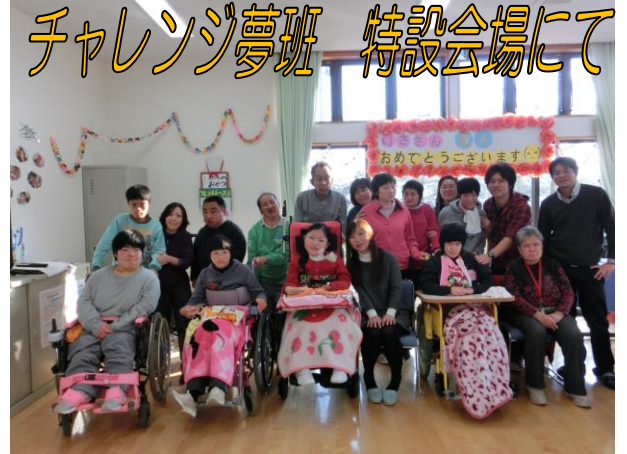
チャレンジ夢班 特設会場にて