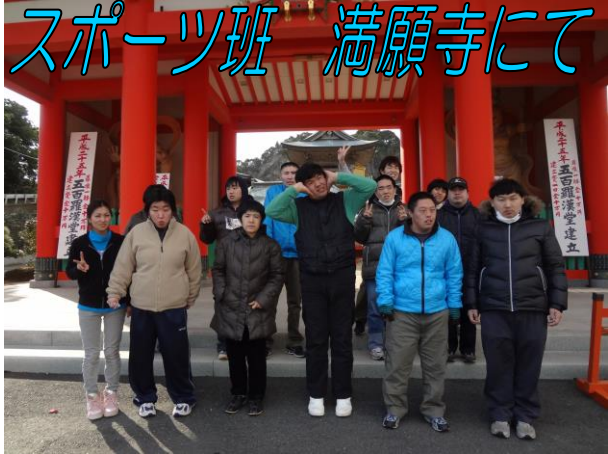
スポーツ班 満願寺にて

当日は、スポーツ班が「ステーキハンバーグ&サラダバー けん」にてお腹と心を満たした後、銚子の満願寺にて成人のお祝いを行いました。一方、チャレンジ夢班においては、チャレンジ班の皆さんも合流し、スライドショーでこれまでの歩みを確認したり、記念品及び色紙の贈呈を行った後、平川地一丁目の「夢見るジャンプ」を全員で声を高らかに歌いました。