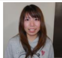
柴 瞳 手工芸班 音楽部