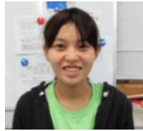
林 彩 手工芸班 リラックス部